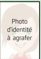
Photo d'identité à agrafier